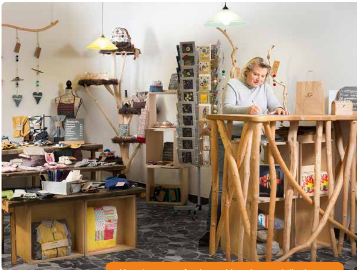
Vous trouverez également tous les produits de nos ateliers dans notre boutique en ligne : emera.ch

des changements, petits et grands, qui interviennent dans tous les domaines et à tous les niveaux. S'ils bousculent les habitudes, ils nous ramènent à l'essentiel de notre mission commune, l'amélioration de la qualité de vie, de l'autodétermination et de l'autonomie des personnes en situation de handicap.